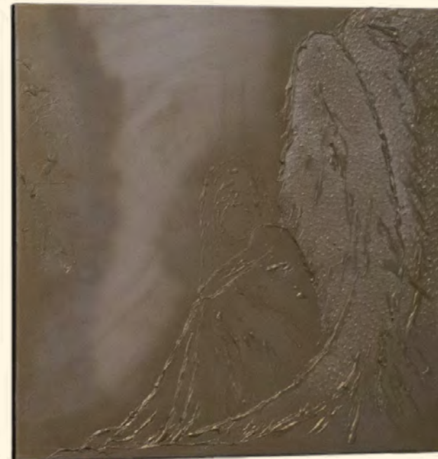
Kunstwerk Artikel 1 Grondwet, dat op initiatief van GroenLinks De Bilt sinds 2018 in het gemeentehuis hangt. Kunstenaar: Iris van Haaren

ARTIKEL 1 ALLEN DIE ZICH IN NEDERLAND BEVINDEN, WORDEN IN GELIJKE GEVALLEN GELIJK BEHANDELD DISCRIMINATIE WEGENS GODSDIENST, LEVENSOVERTUIGING, POLITIEKE GEZINDHEID, RAS, GESLACHT OF OP WELKE GROND DAN OOK, IS NIET TOEGESTAAN.